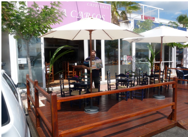
CASA "CARLOS" RECOMIENDA PARA ESTE VERANO REBUJITO EN EL PATIO ANDALUZ SUQUETS MARINEROS PESCADOS DE LA LONJA Y LAS DOCE REFERENCIAS EN ARROS QUE ELABORAMOS.

socios@cnoropesa.com telf.: 964313055 Edita: Carlos Aguilar