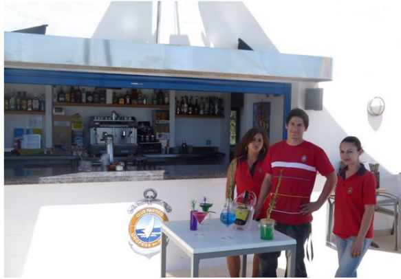
BAR "LA PISCINA". DE 19-20 HORAS CÓCTEL 2 POR 1. A PARTIR 20 HORAS SE SERVIRÁN CENAS..